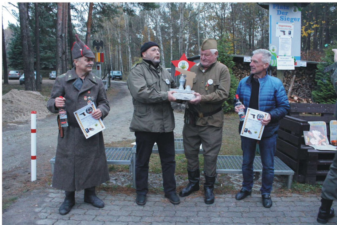
Die Sieger des Mannschaftspokal des VJZP 2017