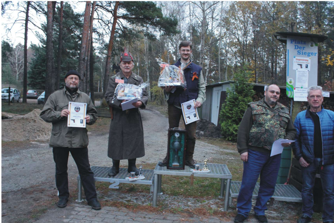
Die Gesamtsieger des VJZP 2017